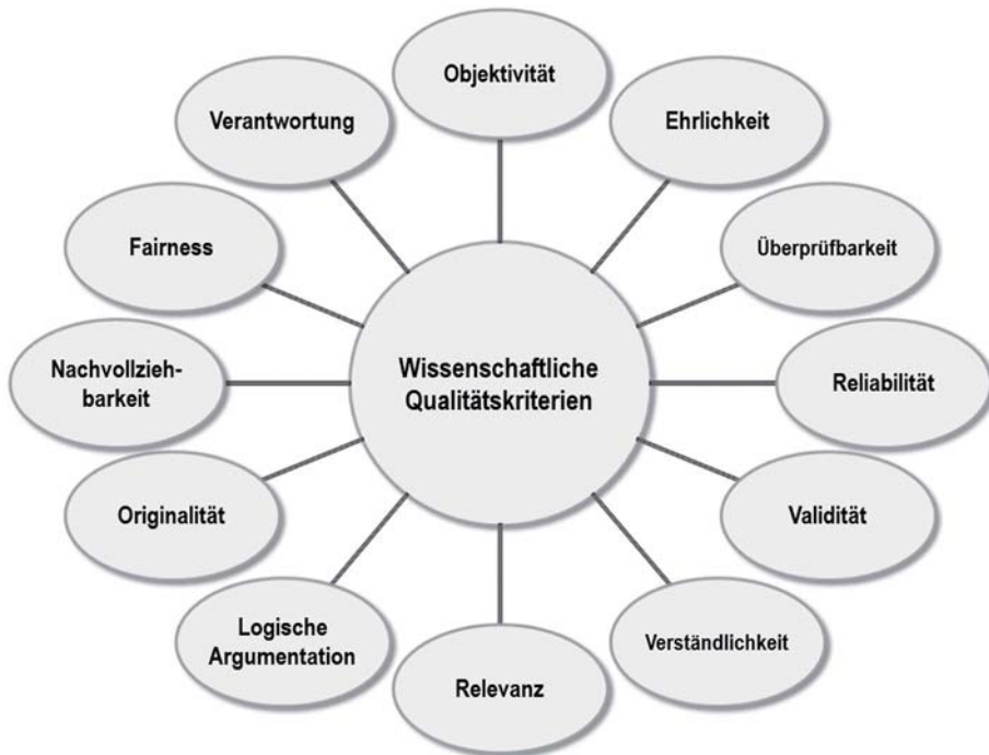
Abb. 3.0-1: Zwölf zentrale wissenschaftliche Qualitätskriterien.

Die Wissenschaft stellt einen riesigen Schatz an systematisch geordnetem Wissen bereit. Weltweit kann man darauf zugreifen, um zu lernen, neue Erkenntnisse zu gewinnen und Produkte und neue Verfahren zu entwickeln. Täuschungen, Fälschungen und anderes wissenschaftliches Fehlverhalten können die Qualität des Weltwissens reduzieren und die Zusammenarbeit sowie das Ansehen der Wissenschaft schädigen. Mithilfe von Ethikkommissionen, Kontrollinstanzen, Qualitätsrichtlinien und die Unterweisung des wissenschaftlichen Nachwuchses sorgt die internationale Scientific Community dafür, dass nur hochwertiges, abgesichertes Wissen veröffentlicht wird. Die Abb. 3.0-1 zeigt die hier behandelten wissenschaftlichen Qualitätskriterien.